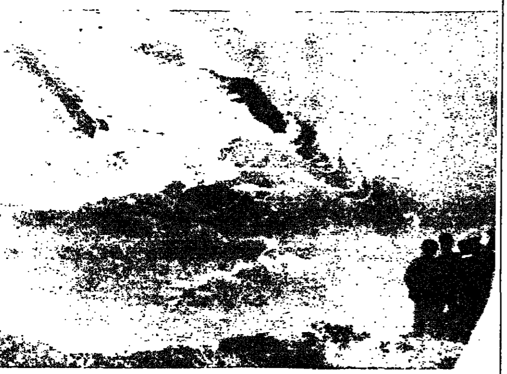
الامواج العاتية تلمح حطام سفينة الشحن التجريبية، ريفر غورارا، بعد غرقها على بعد ٤٠ ميلا الى الجنوب من ليشبون على الساحل البرتغالي وكان انقذ ٢٨ شخصا من طاقمها بينما بقي مصرع ١١ مجبرولا وتوفي ٧.